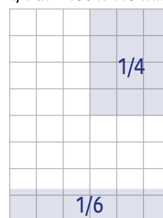
1/6 lk = 210 x 50 mm