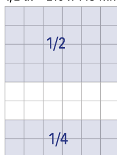
1/4 lk = 210 x 74 mm